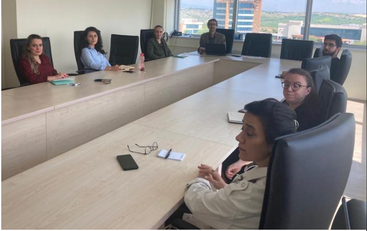
Fotoğraf: FEF Birim Kalite Komisyonu Toplantısı, 26.05.2023